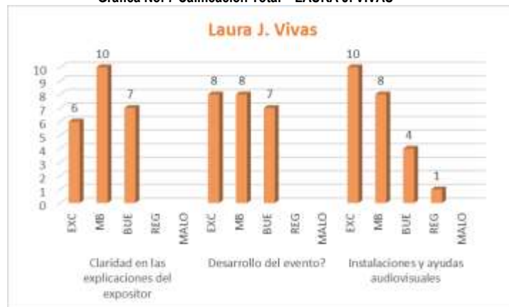
Gráfica No. 7 Calificación Total – LAURA J. VIVAS