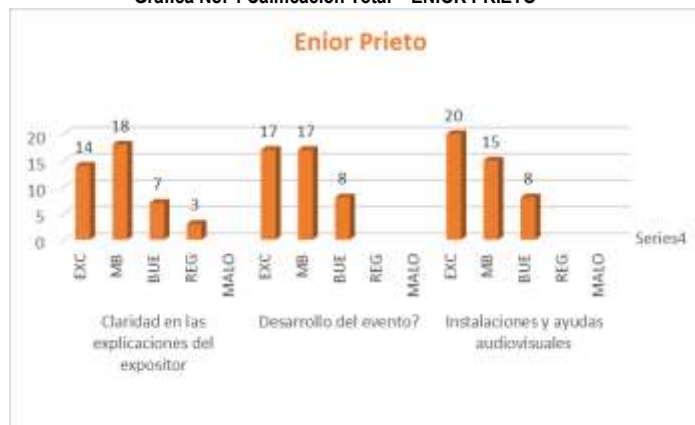
Gráfica No. 4 Calificación Total – ENIOR PRIETO