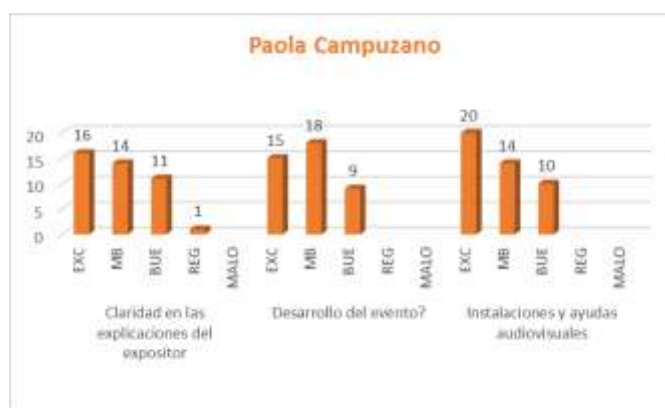
Gráfica No. 1 Calificación Total – PAOLA CAMPUZANO

CONFERENCISTA 2: De los 48 encuestados efectivos, 48 participantes calificaron a la conferencista JUAN CARLOS ARISTIZABAL , en el Evento/capacitación, así: